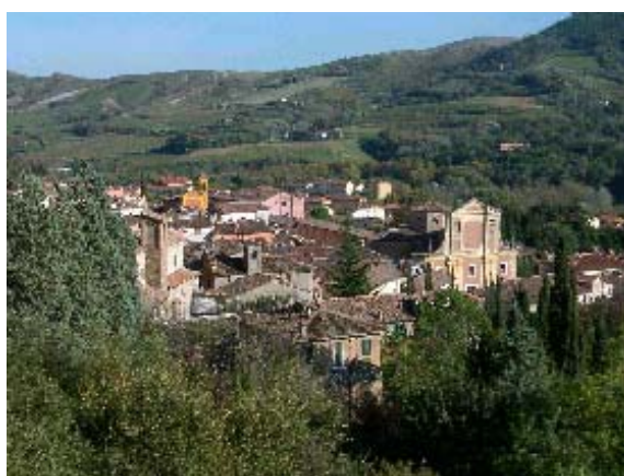
Vista centro storico di Brisighella

Il fabbricato si sviluppa su tre piani: il seminterrato dedicato ai servizi; il primo piano dove ci sono le zone giorno e il secondo piano per la parte notte. La zona verde è stata isolata dal contesto per creare un piccolo habitat solo per i bambini e le bambine in modo che non ci siano interferenze esterne. All'interno delle singole unita' immobiliari si è pensato di predisporre servizi igienici e camere tali da non creare difficoltà ai piccoli abitanti ( interruttori e lavandini più bassi; camere colorate con tinte pastello; cancelli per proteggere le scale, decorate con immagini di animali diversi per ogni alzata). E' stata individuata una stanza per il gioco, caratterizzata da pareti colorate e da un certo tipo di