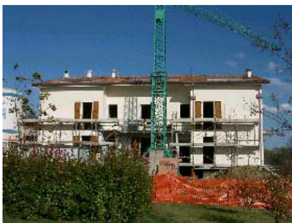
Vista della costruzione e dell' area verde attigua

Per la gestione infine dell'area verde si è fatto riferimento ad una figura particolare e cioè quella del nonno vigile.