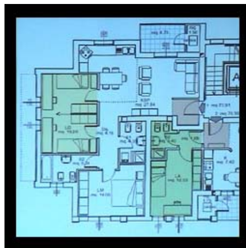
Esempio di tipologia abitativa adeguata alle esigenze dell'infanzia e dell'adolescenza

L'assetto urbanistico del Comparto organizza gli spazi esterni in modo da rendere possibile che per i bambini scaturiscano attività sociali e ludiche che li stimolino ad esperienze fuori dalle mura domestiche. In tale ambito trova particolare accoglienza un progetto che condivide con il Piano urbanistico la volontà di creare opportunità di aggregazione significativa per i bambini in modo graduale: dal microspazio residenziale, allo spazio incontro percepito come pertinente alla propria abitazione, allo spazio pubblico prossimo alla casa. E' un percorso reale e ideale pensato per dare sicurezza ai bambini e per aiutarli ad identificare come territorio proprio lo spazio pubblico prossimo alla casa.