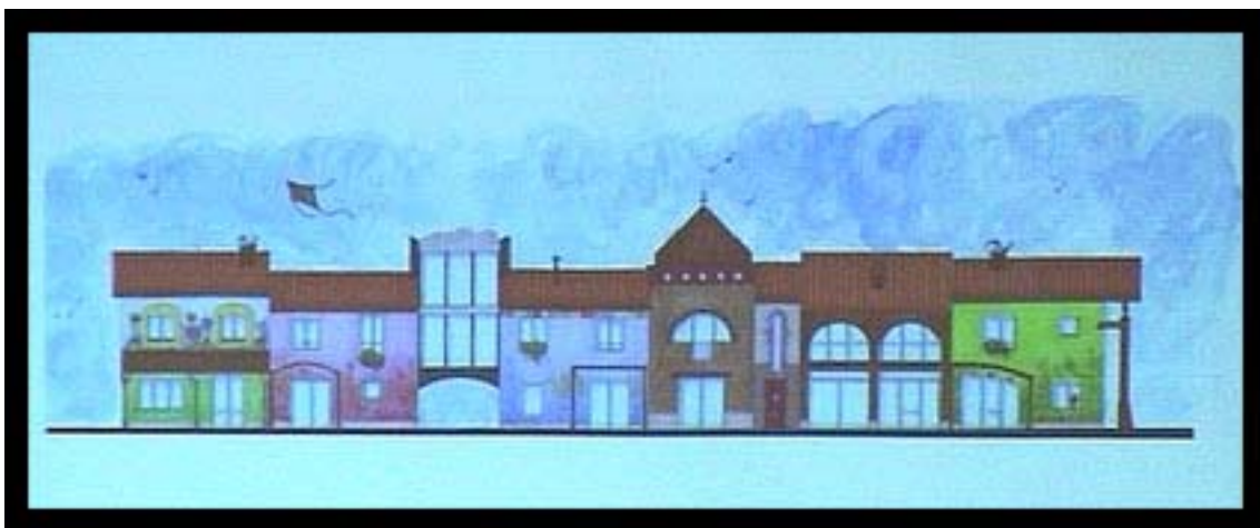
Come la fantasia dei bambini conquista e trasforma le città

Grazie a questo progetto, con grande soddisfazione, Andria ha ricevuto il premio Peggy Guggenheim 2001.