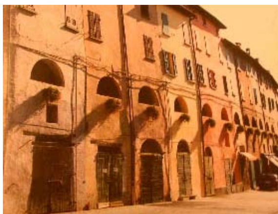
Vista della Via degli Asini

Brisighella cittadina turistica - termale di 7500 abitanti possiede un vasto patrimonio edilizio, che e' costituito da un centro storico che evidenzia l' omogeneita' architettonica dell' insieme e la perfetta integrazione con il contesto ambientale-paesaggistico, da una zona urbana sviluppata nel dopoguerra in modo caotico, con tipologie che avevano una funzione di fornire residenze a costi contenuti e da piccole costruzioni con tipologia di villetta monofamiliare e plurifamiliare. Altre zone di piu' recente costruzioni, sviluppatasi su